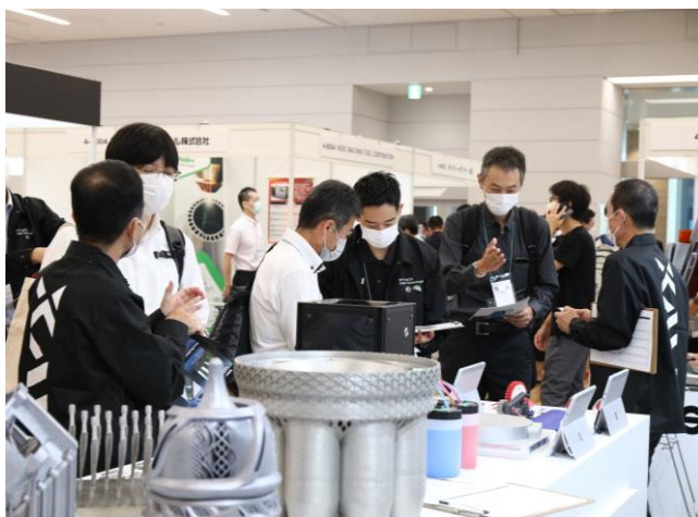
「フォームネクストフォーラム 東京 2022」の会場の様子と出展製品